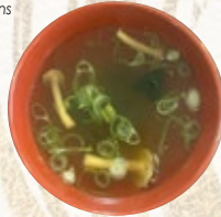
SOUPE MISO 4€ Wakamé, champignons shimeji, cebettes