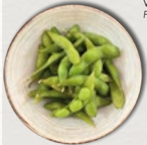
ÉDAMAMÉ 4,50€ graines de soja à la vapeur Blanched green soybeans in pods