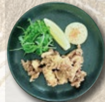
IKAGESO-AGUÉ 7€ tentacules de calamars frits Fried squid tentacles