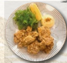
KARA-AGUÉ 8,50€ cuisse de poulet frit 5 pieces of Deep fried chicken