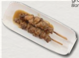
YAKITORI 6€ brochettes de poulet à la sauce soja 2 skewers of grilled chicken in sweet soy-sauce flavour