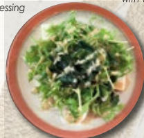
SALADE JAPONAISE tofu, wakamé, and mizuna greens - petite 6€ - grande 9,5€