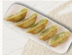
GYOZA LÉGUMES 7€ raviolis grillés aux légumes 5 pieces of pan-fried dumplings with vegetable filling