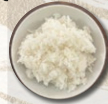
BOL DE RIZ 3,50€ White rice