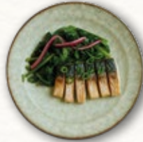
ABURI SHIME SABA 9€ maquereau mariné au vinaigre, wakamé sauce ponzu Pickled mackerel, wakamé, ponzu dressing