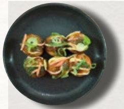
TAKOYAKI 7,50€ boulettes de crêpe salée au poulpe Deep fried octopus balls with Japanese BBQ sauce